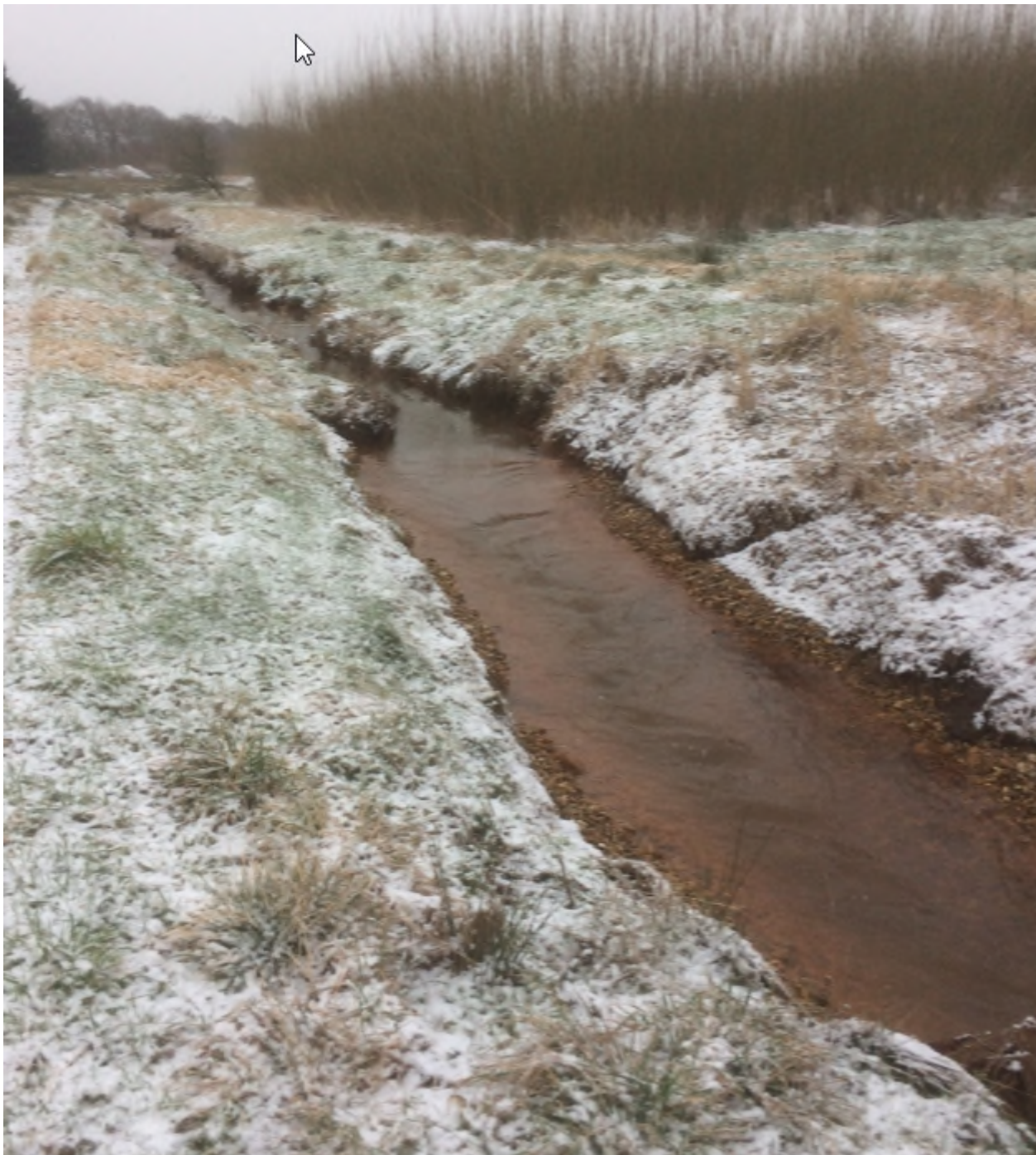
Udlagt gydegrus i Bindsbøl Bæk.

Vi forventer, at de forbedrede fysiske forhold over en årrække vil sikre målsætningsopfyldelse med god økologisk tilstand for både makrofytter, fisk og smådyr.